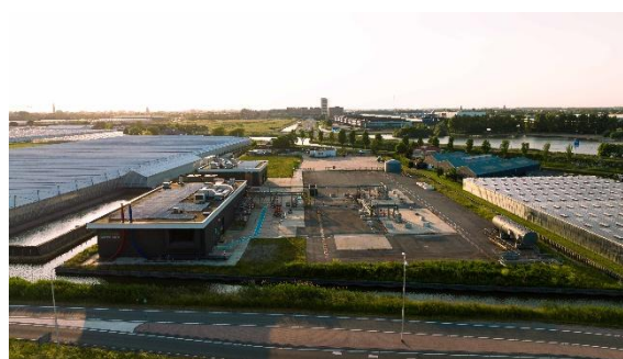
Aardwarmtelocatie, Trias Westland, Alkmaar