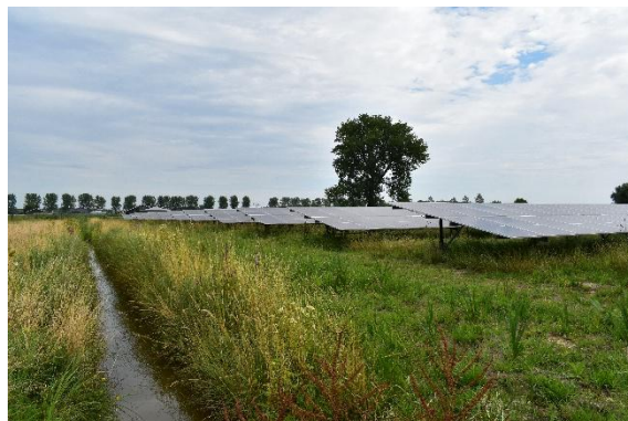
Zonnepark Ficarystraat, Ewijk