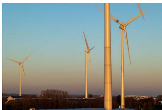
Zon- en windpark Koningspleij, Arnhem