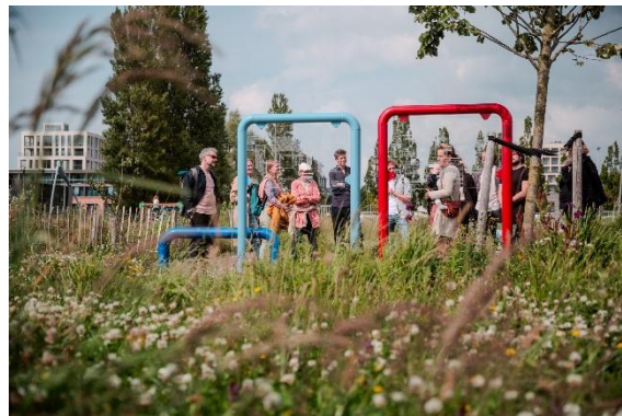
Verduurzaming wijk met bewoners, Amsterdam