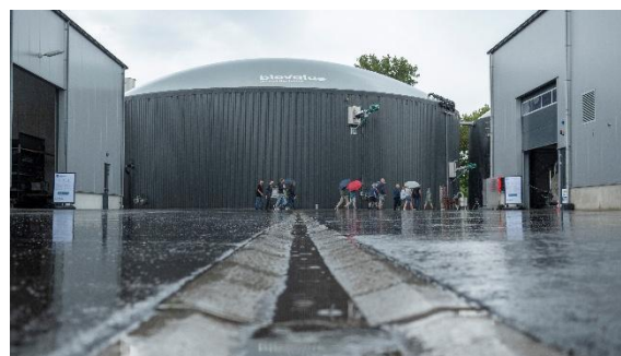
Groengas Biovalue, Cothen

Groen gas is een duurzaam en goed alternatief voor aardgas. Van mest, afval, rioolslib en reststromen uit de landbouw die niet meer geschikt zijn voor menselijke of dierlijke consumptie, wordt groen gas geproduceerd door middel van vergisting. Dat past in een circulaire economie. Groen gas is energie van eigen bodem die direct kan worden ingevoerd op het bestaande gasnet, zonder aanpassingen bij inwoners of bedrijven, en ons minder afhankelijk maakt van import.