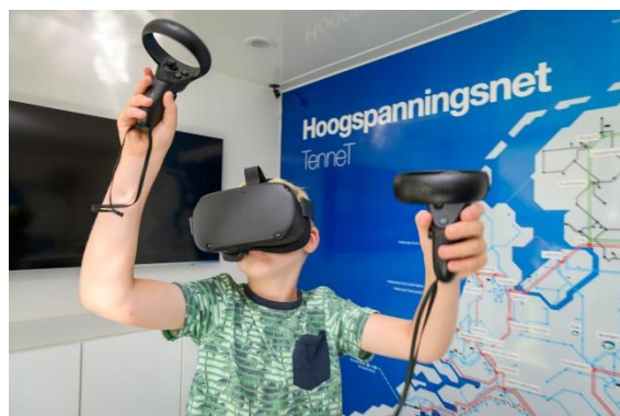
Op bezoek bij Tennet, Nieuwdorp