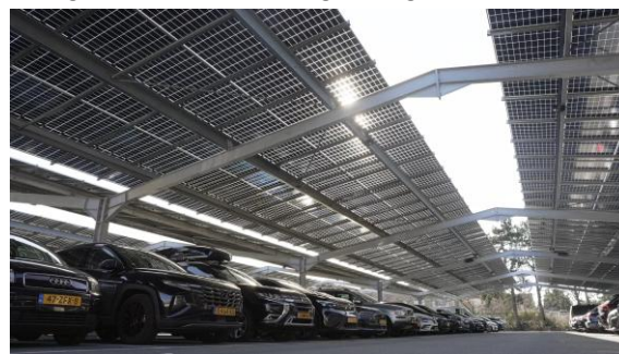
Solar parking de Kuil, Bussum