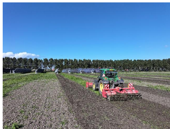
Agri-PV Symbizon, Almere