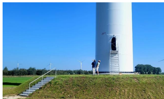
Windpark Hoge Vaart zuid, Dronten