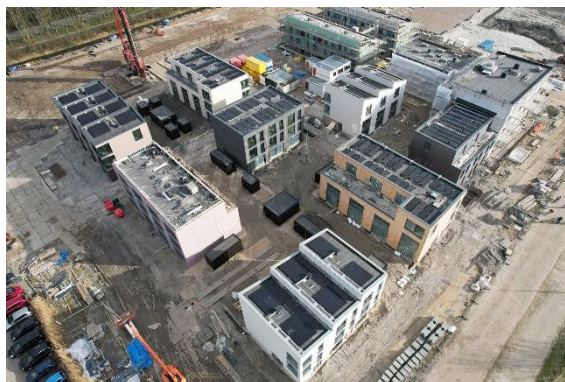
Duurzame woningen, Hoorn