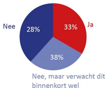
Figuur 1: Respons op de vraag 'Hebben de verhogingen van de rentetarieven nadelige invloed op uw financieringsmogelijkheden?'

Eén derde van de bedrijven ervaart nu al nadelige effecten van de hogere rentetarieven op hun financieringsmogelijkheden (zie Figuur 1). En een meer dan één derde ervaart deze nu nog niet, maar verwacht in de nabije toekomst wel moeilijkheden. Met name de gestegen kosten van de lening/investering worden genoemd als effect van de hogere rente. Ook zien meerdere bedrijven dat de financieringsmix van de onderneming en/of investering is veranderd. Een ander significant nadelig effect van de hogere rente is dat er projecten worden uitgesteld of afgeblazen, bijna een derde van de bedrijven heeft dit ervaren.