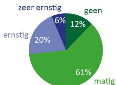
Figuur 3: Respons op de vraag 'Verwacht u dat de hoge rente, energieprijzen, en andere marktomstandigheden de energietransitie vertraagt en dat de gestelde doelen voor 2030 moeilijker haalbaar zullen zijn?'

Een verontrustend beeld komt naar voren uit de antwoorden op de vraag wat de verwachtingen zijn over het effect van de hoge rente, energieprijzen, en andere marktomstandigheden op de (mogelijke) vertraging van de energietransitie en de gestelde doelen voor 2030. Meer dan 80% geeft aan dat zij matige, ofwel ernstige, vertraging voorzien (zie figuur 3).