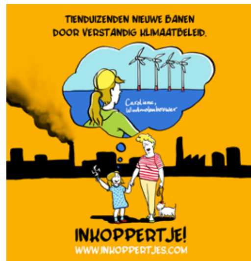
april 2019 Een goed Klimaatakkoord is een inkoppertje