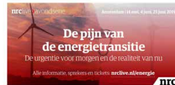
Feb 2019 NRC Live: De pijn van de energietransitie