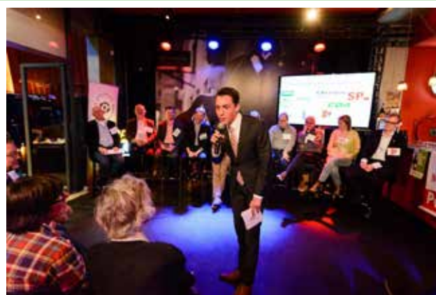
Mei 2019 EU-verkiezingsdebat Energie en Klimaat 8 mei 2019